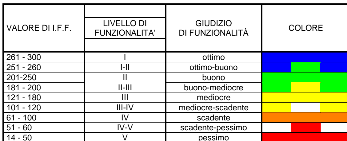
Tabella 1 – Livelli di funzionalità, relativi giudizi e colori di riferimento