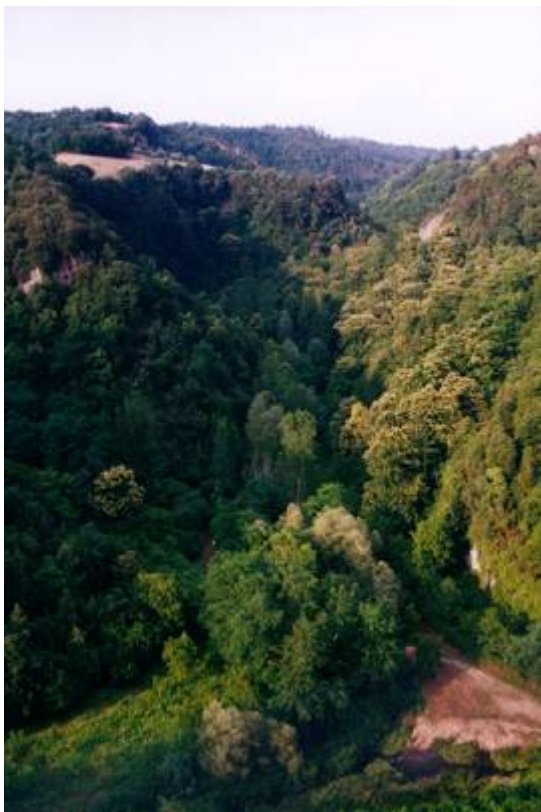
Foto 2 - La valle del Lente tra Sorano e Pitigliano