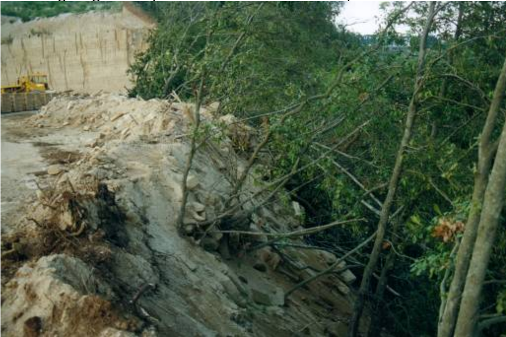
Foto 8 - Cava a monte di Sorano. Nella foto è visibile un "canale di scolo" di un piccolo bacino originatosi a causa dell'attività estrattiva. Lungo questi canali viene trasportata la maggior parte dei sedimenti che poi si riversa direttamente in alveo

Foto 7 - Oltre ai massi di grosse dimensioni anche il materiale fine, derivato dal taglio e dallo sgretolamento delle pietre, esercita un forte impatto negativo sull'ecosistema fluviale. Per effetti del dilavamento superficiale, infatti, le sabbie giungono rapidamente al corso d'acqua, alterandone la funzionalità.